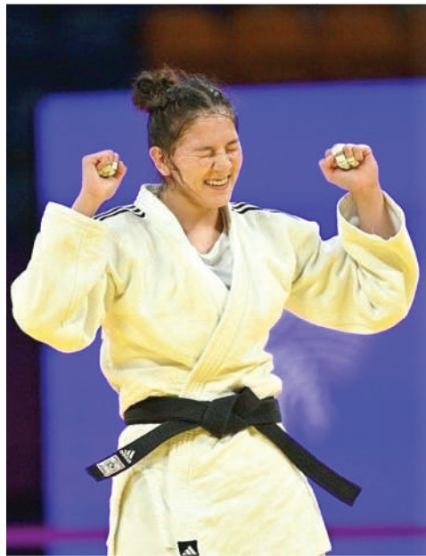
НАҚТЫ БОЛЖАУ ҚИЫН

Ел құрамасын дзюдодан алда Азия чемпионаты күтіп тұр. Аталмыш жарысқа әлемдік жұлдыздар мен Олимпиада жүлдегерлері қатысатыны анық. Былтырғы жылды еске алсақ, құрамамыз сәтсіз өнер көрсеткен еді. Биыл соның есесін қайтару керек. Ал Қазақстан құрамасының атынан кімдер бақ сынайды? Ұлттық құраманың қазіргі дайындығы қалай өтіп жатыр? Осы сияқты сұрақтардың жауабын талдап көрейік.