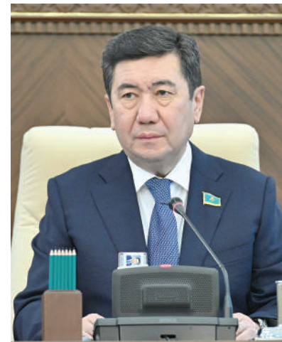
Ерлан ҚОШАНОВ, Парламент Мәжілісінің Төрағасы

24 сәуір күні Қазақстан халқы Ассамблеясының тарихи сессиясы өтті. Іс-шарада Мемлекет басшысы Ассамблеяның 30 жылдық жолын қорытындылап, оның еліміздің табысты дамуындағы стратегиялық рөлін атап өтті.