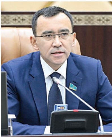
Мәулен ӘШІМБАЕВ, Парламент Сенатының Төрағасы

Президентіміз Қасым-Жомарт Тоқаевтың төрағалығымен Қазақстан халқы Ассамблеясының жыл сайынғы сессиясы өтті. Бұл жиынның бұрынғылардан мәні мен маңызы зор. Себебі биыл Ассамблеяның құрылғанына мерейлі 30 жыл толып отыр. Мемлекет басшысы атап өткендей, осы уақыт ішінде Ассамблея бейбітшілік пен келісімнің және бірлік пен берекенің шынайы символына айналды. Сондай-ақ этносаралық татулықтың қазақстандық үлгісінің берік негізі ретінде қалыптасты.