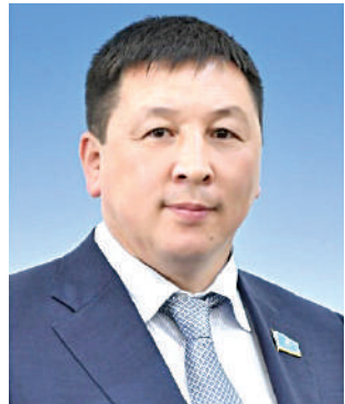
Данияр ҚАСҚАРАУОВ, Парламент Мәжілісінің депутаты: