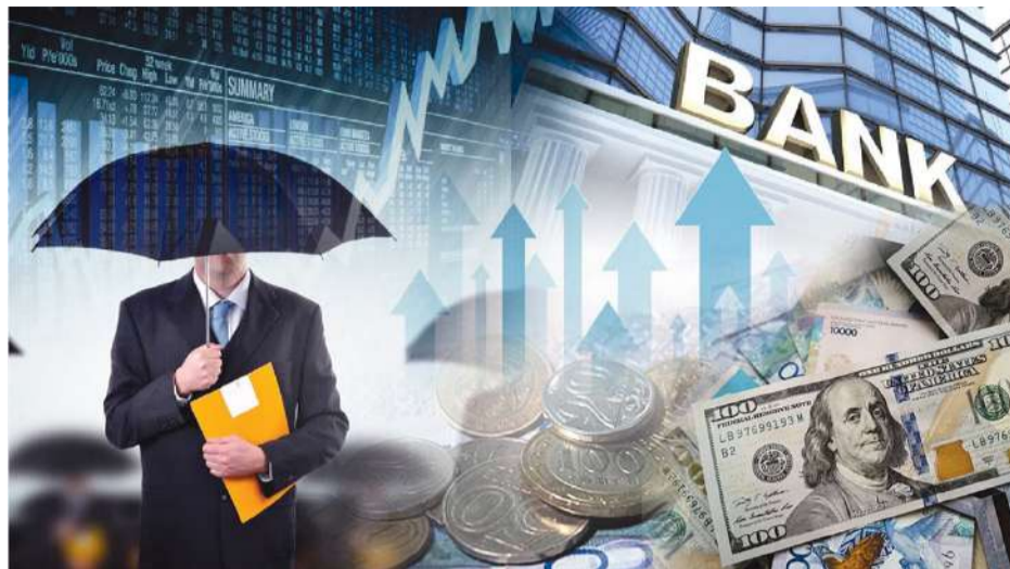
Еллар КАБА (қолжазы)

ҚАЗАҚСТАННЫҢ ҚАРЫЗЫ ТАРИХИ РЕКОРДҚА ЖЕТКЕНІ АЙТЫЛЫП ЖҮР. БҰҒАН ҰЛТТЫҚ БАНКТИҢ ТАЯУДА ЖАРИЯЛАҒАН ЕСЕБІ НЕГІЗ БОЛДЫ. 2024 ЖЫЛҒЫ I ТОҚСАН ҚОРЫТЫНДЫСЫНДА ҚАЗАҚСТАННЫҢ СЫРТҚЫ БОРЫШЫ 165,3 МИЛЛИАРД ДОЛЛАРДАН АСҚАН. ФАКТЧЕККЕ ЖҮГІНСЕК, БҰДАН ЖОҒАРҒЫ РЕКОРДТЫҚ МЕЖЕ ТЕК 2018 ЖЫЛҒЫ ҚАҢТАРДА ТІРКЕЛІПТІ: СОНДА СЫРТҚЫ ҚАРЫЗ 167 МЛРД 482,7 МЛН ДОЛЛАРДЫ ҚҰРАДЫ. БІРАҚ БҰЛ БӘРІБІР ЖҰБАНАТЫН ЖАЙТ ЕМЕС: МЕМЛЕКЕТТІК БОРЫШ БОЙЫНША 2030 ЖЫЛҒА БЕЛГІЛЕНГЕН ШЕККЕ ЕЛ ҚАЗІРДЕН ТАЯП ҚАЛДЫ.